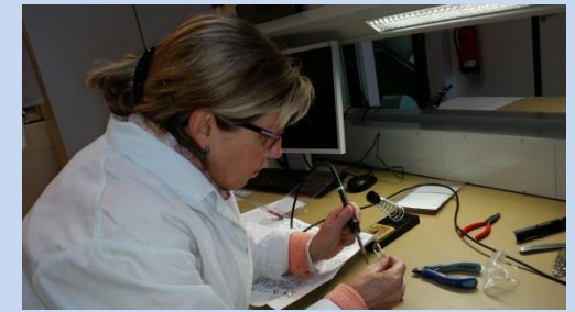
... bei Fa. Bender