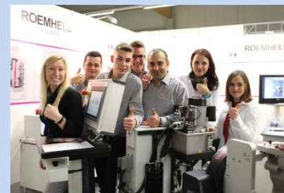
... bei Fa. Roemheld