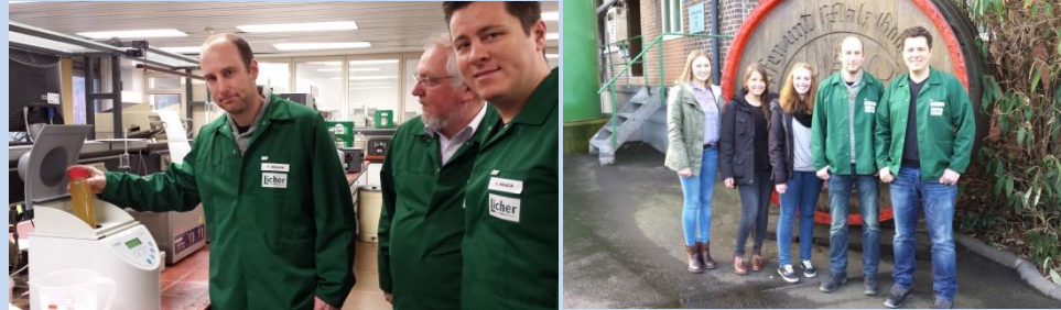
... in der Licher Privatbrauerei