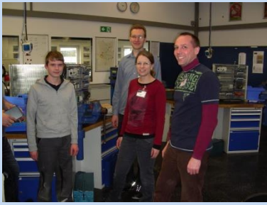
... bei Fa. Weiss Umwelttechnik