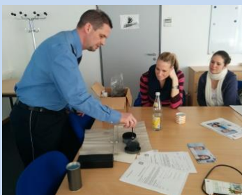
... im Polizeipräsidium Mittelhessen