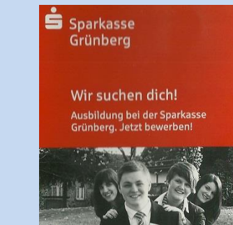
... in der Sparkasse Grünberg